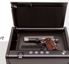
Caja con llave