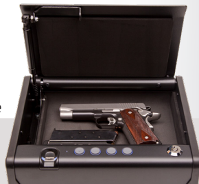
Caja con llave

Para saber más, visite: facs.org/quality-programs/trauma/ipc